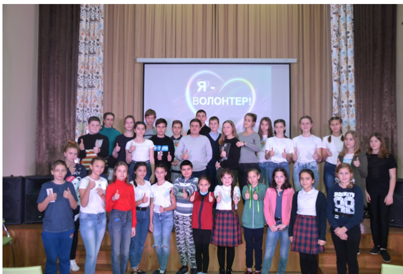
Волонтерский отряд «Галактика» Дома детского творчества