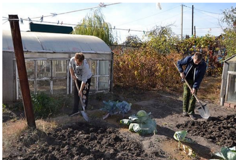
Ребята из волонтерского отряда оказывают помощь на участке