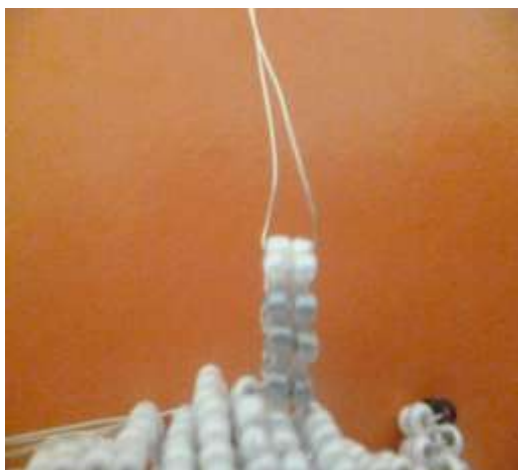
Схема задних ног: